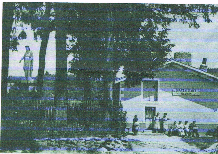
« Statue de la vierge à Félines et café restaurant Maurin »